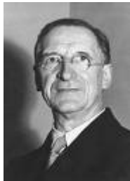
Éamonn de Valera