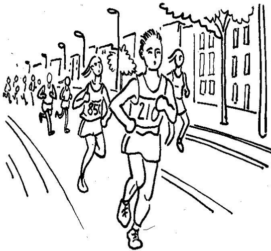
1. Ag rith